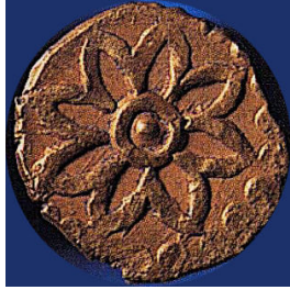
Dinar Matahari Kelantan-Pattani pada kurun ke-8