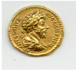
Gambar rajah 1: Syiling Emas Terawal Di Mekah

Denar , syiling emas Roman yang pertama diperkenalkan pada tahun 211