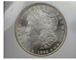
Syiling Perak AS$10

Sumber: Hakimi Ibrahim (2004), “History of the Gold Dinar and its Philosophy”, (Kertas Kerja Bengkel Dinar Emas , Bangi: UKM, pada 30 Julai 2002).