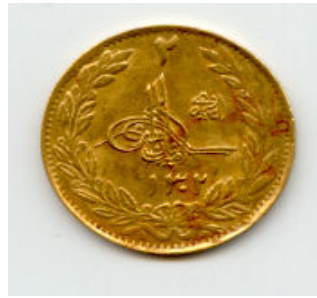
Gambar rajah 4: Dinar Emas Terakhir Umat Islam

Turki 1923 Zaman Kejatuhan Khalifah Uthmāniah 1924