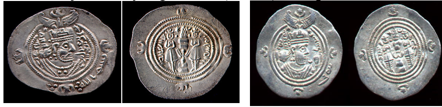
Dirham Pertama Mengikut Acuan Sassan dari Yazdgerd III 652 – 660 (Khalifah 'Uthmān) Syiling ini terdapat ukiran "Bismillahi"