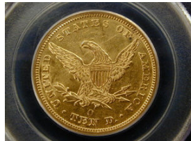
Syiling Emas AS$10