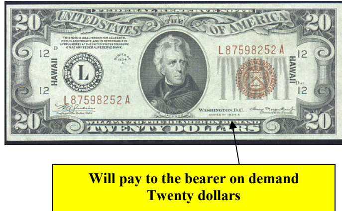
Gambar rajah 10: Contoh Mata Wang Dolar Sekarang

Maka, bolehlah dikatakan bahawa nilai wang kertas hari ini ditentukan oleh dolar Amerika Syarikat. Gambar rajah 10 menunjukkan ringkasan kronologi mata wang dunia yang berasal daripada logam bernilai emas dan perak akhirnya telah bertukar dengan kertas yang tidak bernilai.