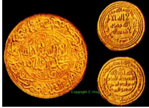
Gambar rajah 3: Dinar Emas Yang Digunakan Dalam Kurun ke-8 sehingga Kurun ke-11

Dinar Emas pada zaman pemerintahan Khalifah Hisyam Ibn Abdul Malik pada tahun 723