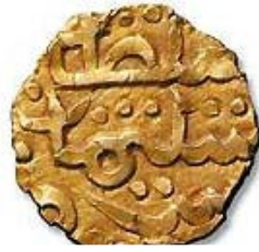
Kupang Kelantan dan Pattani tahun 1500-1700