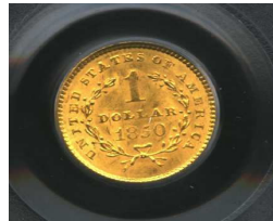
Syiling Emas AS$1 1850