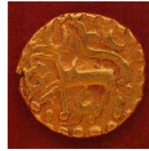
Kijang Emas Kelantan Kurun ke-14

Sumber: Hakimi Ibrahim (2004), “History of the Gold Dinar and its Philosophy”, (Kertas Kerja Bengkel Dinar Emas , Bangi: UKM, pada 30 Julai 2002)