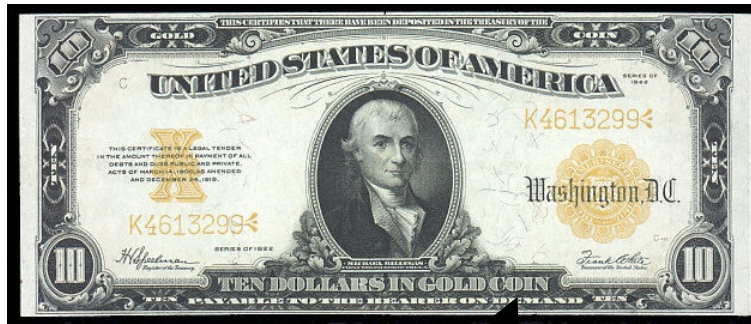
Gambar rajah 9: Contoh Wang Kertas AS$10 Siri 1929

Ten dollars in Gold Coin (1922) Payable to the bearer on demand