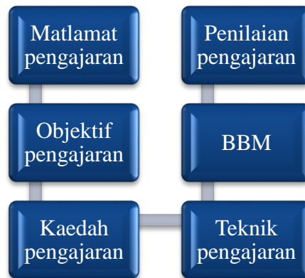
Rajah 1. Model Pengajaran al-Quran (al-Qabisi, 1955)