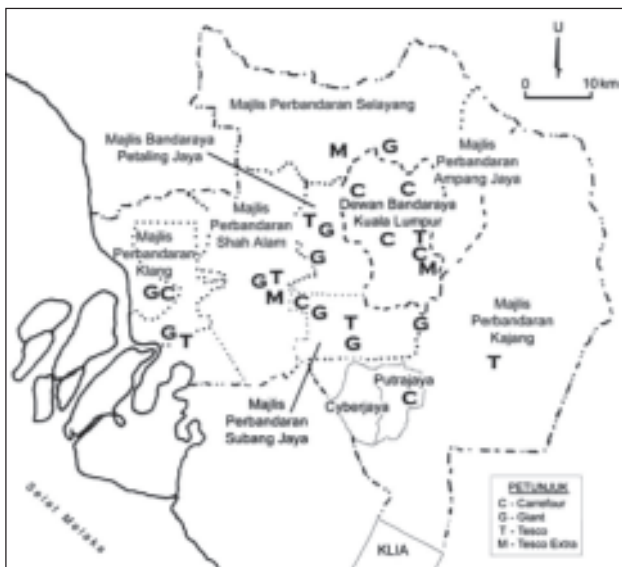
Peta 1: Taburan Hypermarket Asing di Lembah Klang

Hypermarket asing yang terdapat di Lembah Klang adalah yang paling banyak iaitu sebanyak 26 buah (Lihat Peta 1). Jika dilihat taburan lokasi hypermarket mengikut PBT menunjukkan ketidakseimbangan, PBT yang paling banyak mempunyai hypermarket asing adalah Kuala Lumpur sebanyak 7 buah, diikuti oleh Subang Jaya (5), Klang (4), Shah Alam (3), Petaling Jaya (3) dua buah di Selayang dan masing-masing satu di Kajang dan Putrajaya (Lihat Jadual 1.2). Jika berdasarkan syarikat hypermarket pula, Giant mempunyai cawangan yang terbanyak iaitu sembilan buah cawangan, diikuti oleh Carrefour (8), Tesco (6) dan Tesco Extra (3) (Lihat Jadual 1.3).