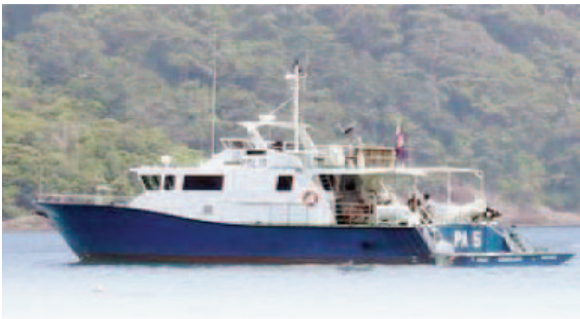
Gambar 2: BOT Camar 1 PA5 merupakan antara aset terbaru PDRM. Ia bertanggungjawab meronda kawasan perairan termasuk di Pulau Tenggol, Terengganu