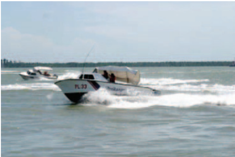
Gambar 11: Bot Laju Milik Jabatan Perikanan Digunakan Dalam Tugas-Tugas Penguatkuasaan Undang-Undang Maritim Negara