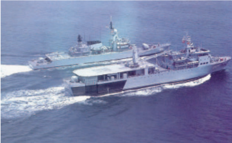
Gambar 4: KD Sri Inderapura merupakan kapal terbesar daripada jenis Landing Ship Tank yang sering digunakan dalam rondaan