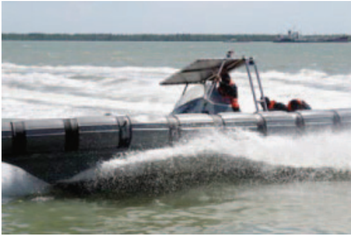
Gambar 3: Bot laju milik Polis Marin ini berkeupayaan bertindak sebagai 'assault boat', terutama semasa menaiki bot sasaran atau melakukan serangan ke darat