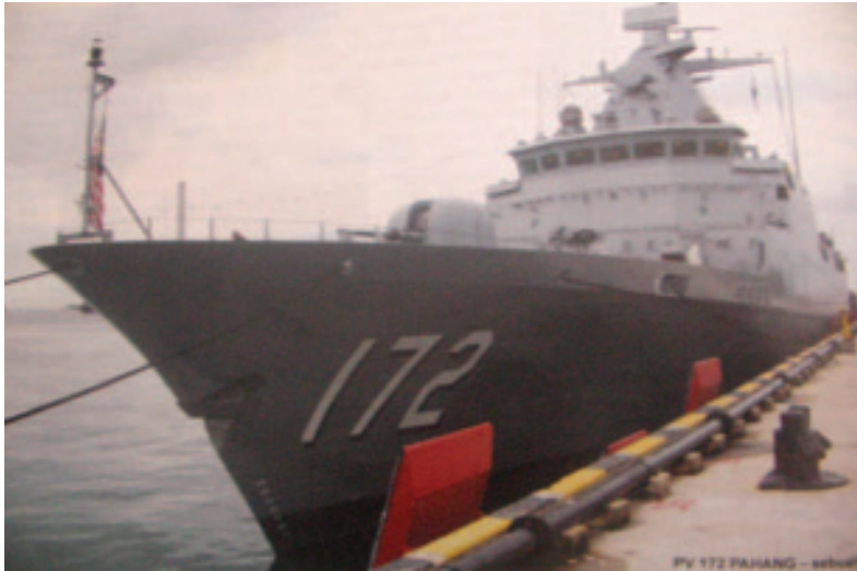
Gambar 6: Offshore Petrol Vessel, KD Pahang (172) juga merupakan aset terbaru TLDM