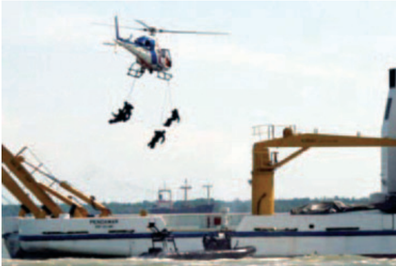
Gambar 13: Pasukan Gerakan Khas (PGK) PDRM menuruni helikopter ke kapal sasaran