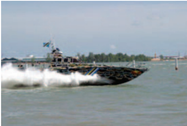
Gambar 12: Bot laju milik Jabatan Kastam dan Eksais Diraja

Akta Kastam 1967. Ringkasnya jabatan ini hanya mengkhusus kepada kegiatan penyeludupan dan lain-lain aktiviti penguatkuasaan. Jabatan ini juga menjalankan risikan dan penyiasatan membabitkan aktiviti penyeludupan sama ada di laut atau di darat (meliputi sepanjang pantai negara dan juga kawasan sekitar setiap pelabuhan atau jeti). Jabatan Kastam juga kini dilengkapi dengan 97 buah bot dari pelbagai saiz untuk memudahkan operasinya. Perangkaan tahun 1998 menunjukkan jabatan ini telah menjalankan rondaan sebanyak 4, 380 jam berdasarkan laporan tahunan yang dikeluarkan oleh PPPM pada tahun 1998. 24