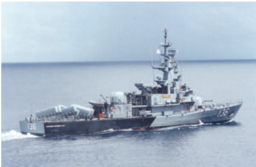
Gambar 9: Laksamana Kelas, Kd Laksamana Muhammad Amin memiliki senjata Exocet