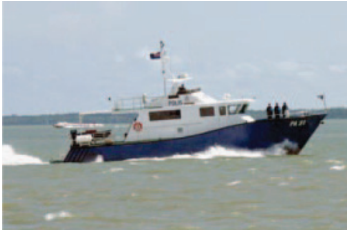
Gambar 1: 'PA 31' milik Polis Marin melakukan rondaan di Perairan 'Inshore' Malaysia

Pada hari ini, TLDM terus menjadi tunjang pertahanan laut negara yang penting terutama sekali di ZEE. Pangkalan utama TLDM teletak di Lumut. Terdapat dua lagi pangkalan hadapan yang terletak di Kuantan (markas Wilayah Satu) dan Labuan (Markas Wilayah Dua). Terdapat sebuah pangkalan hadapan di Sandakan. Perancangan untuk membina empat lagi pangkalan sokongan iaitu di Teluk Sepanggar dan