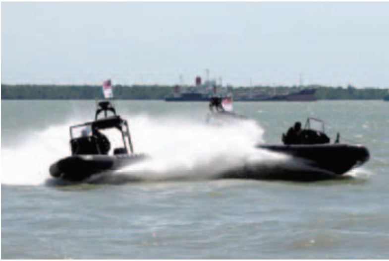
Gambar 10: Bot milik pasukan elit TLDM, PASKAL