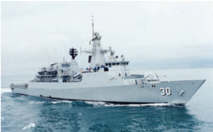
Gambar 7: KD Lekiu, kapal jenis Frigat dalam Kelas Lekiu yang berfungsi sebagai aset serangan TLDM