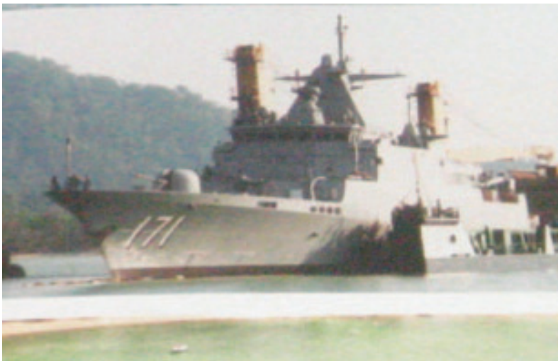
Gambar 5: KD Kedah (pennant no 171) merupakan jenis OPV Kelas Kedah (MEKO A-100 Class patrol vessels)