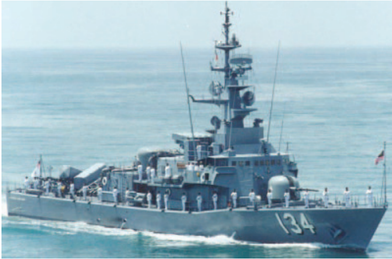
Gambar 8: KDHang Nadim (134) sedang melakukan rondaan di Selat Melaka